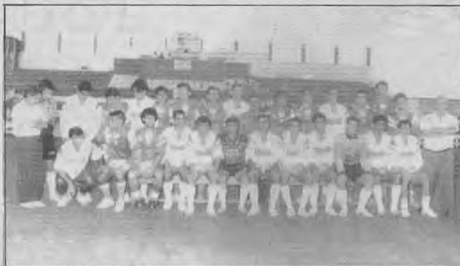
La plantilla alcalaense confirmó que este año va a darle muchas alegrías a su afición.

No era más que el primer aviso del auténtico calvario que pasaría el conjunto local en la primera mitad. En esta el Alcalá se adueño del campo y jugó como quiso. Choya, Marcos y Vega cazaban todos los balones de sus alrededores y los pasaban a sus compañeros