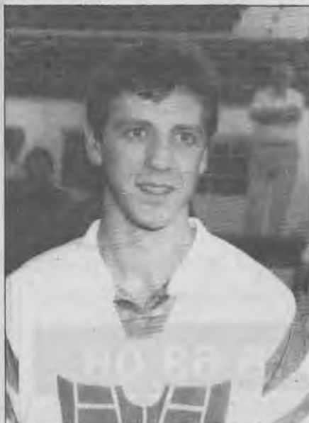
El jugador sevillano Joaquín ya cogido el sitio y fue destacado.

El ex-sevillista parece un 'chiquillo' y en Tocina demostró que por él no pasan los años